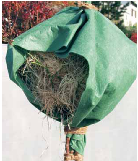
Abdecken mit Tannenreisig und Winterschutzvlies

Bei Rosen ist die Veredlungsstelle vor Frost zu schützen; dem wird normalerweise bereits bei der Pflanzung Rechnung getragen, indem die Veredlungsstelle mit Erde bedeckt wird. Trotzdem sind Rosen zusätzlich anzuhäufeln, indem man sie mit 15 bis 20 cm hohen Erd- oder Erd-/Misthügeln oder mit Tan-