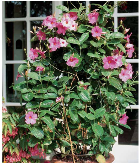
Mandevilla® im Kübel

Grundsätzlich sind die Sonnenstars sehr robuste und widerstandsfähige Pflanzen. Normalerweise treten keine Schädlinge auf. Bei Stress können jedoch vereinzelt Schmier- und Wollläuse auftreten. Bei einem geringen Befall können diese Parasiten von Hand abgelesen oder mit einem Schwamm abgewaschen werden. Andernfalls kommen Sie mit einem handelsüblichen Insektizid zum Ziel. Sobald aber die Pflanze den Stress überwunden hat, sind auch Schädlinge nicht mehr vorhanden. Sie wird von Schnecken gemieden und ist somit auch für Flächenpflanzungen und Friedhof geeignet.