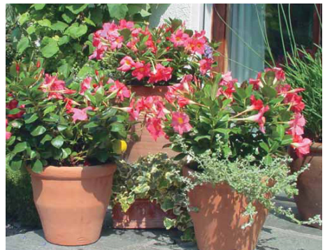
Tropidenia® auf der Terrasse

Die Mandevilla ist eine rosa oder weiss blühende Schlingpflanze mit grossen eiförmigen Blättern aus Brasilien. Sie wächst äusserst schnell, kann bis zu drei Meter lang werden und bedeckt innert Wochen grössere Flächen an Wänden und Pergolen. Auch sie schätzt ein Winterquartier in einem luftigen Wintergarten. Die Mandevilla muss regelmässig im Frühling in humose, durchlässige Erde umgetopft werden.