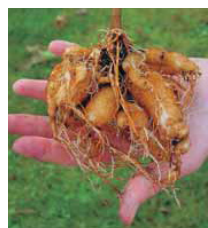
Speicherwurzeln der Tropidenia®